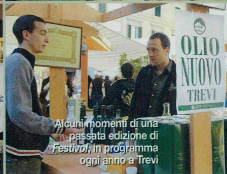
Alcuni momenti di una passata edizione di Festival , in programma ogni anno a Trevi